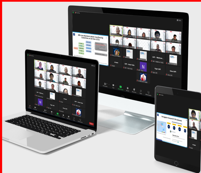
Dokumentasi Webinar ASEAN CPA: Embracing the Opportunities in a Borderless World.

Peluang dan potensi pasar bagi ASEAN CPA juga dapat kita lihat berdasarkan data pertumbuhan ekonomi di negara-negara ASEAN. Misalnya pada negara dengan pemegang ASEAN CPA yang masih sedikit, yaitu di Vietnam, Brunei Darussalam, Kamboja dan Laos, ternyata tahun 2021 mengalami pertumbuhan GDP yang hampir mencapai 3% meskipun dalam masa pandemi Covid-19.