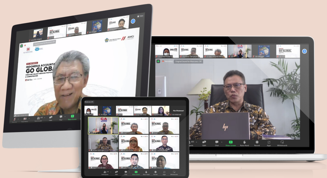
Dokumentasi Webinar Indonesia Accountants Go Global: Creating Value Through Professionalism & Competencies.